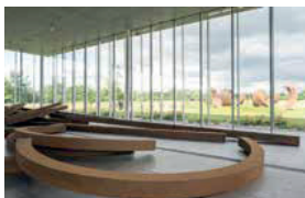
Bernard Venet, Louvre Lens

Une exposition monographique de l'artiste contemporain Bernard Venet, avec une œuvre monumentale qui habite les 1000 m 2 du lumineux Pavillon de verre et reconfigure le paysage intérieur et extérieur du musée.